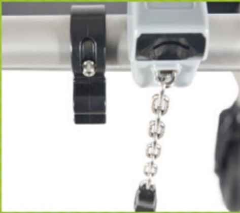
Münz- oder Kartentrückgabe- mechanismus